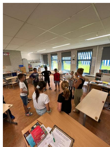
Tafels leren door de bal te gooien

En verhalen schrijven zo bedacht de klas samen: Als ik de baas van school zou zijn..... Er zou een heleboel veranderd worden. De kinderen wilden van lokaal D een gamehal maken, van lokaal C een manege, van groep B een fastfood en van groep A een dierenknuffel klas. En....natuurlijk, elke dag snoep mee naar school. Gelukkig maar dat de kinderen van groep C nog niet de baas zijn van school.