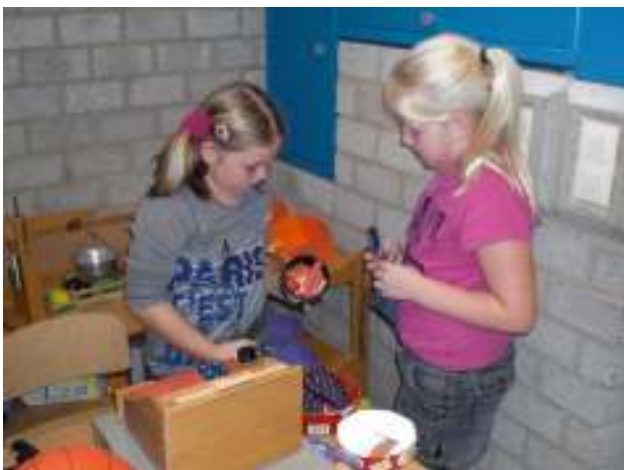
Het onderwijs in de Nederlandse taal en Rekenen/Wiskunde omvat samen ruim de helft van de

totale onderwijstijd. De instructie vindt plaats waar mogelijk in (sub)groepen volgens het BHV-principe (basisstof, herhalingsstof, verrijkingsstof) in een groepsplan. Zo nodig wordt voor een individuele leerling een apart handelingsplan gemaakt.